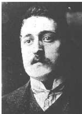
Guillaume Apollinaire Alcools (1912)